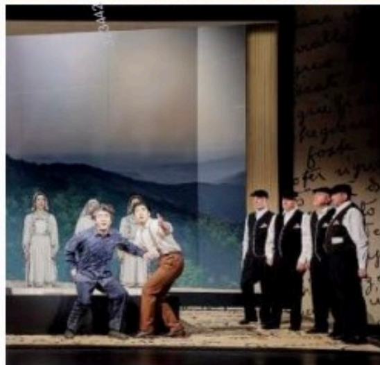
LE PROVE Due momenti delle prove nel Gerhart Hauptmann Theater di Görlitz, in Sassonia

a tenore. Il quartetto di Bitti ha preso parte alle prove con l'orchestra per dare corpo alla collaborazione tra il Tenore e il compositore olandese. Un'idea nata nel 2009 quando Cord Meijering ascoltò il gruppo sardo durante un concerto al Concertgebouw di Amsterdam e nella sua mente sbocciò l'idea di includere questa espressione musicale, eredità di una cultura arcaica e affascinante, in un'opera da comporre negli anni a seguire. E ora, quel progetto è diventato real-